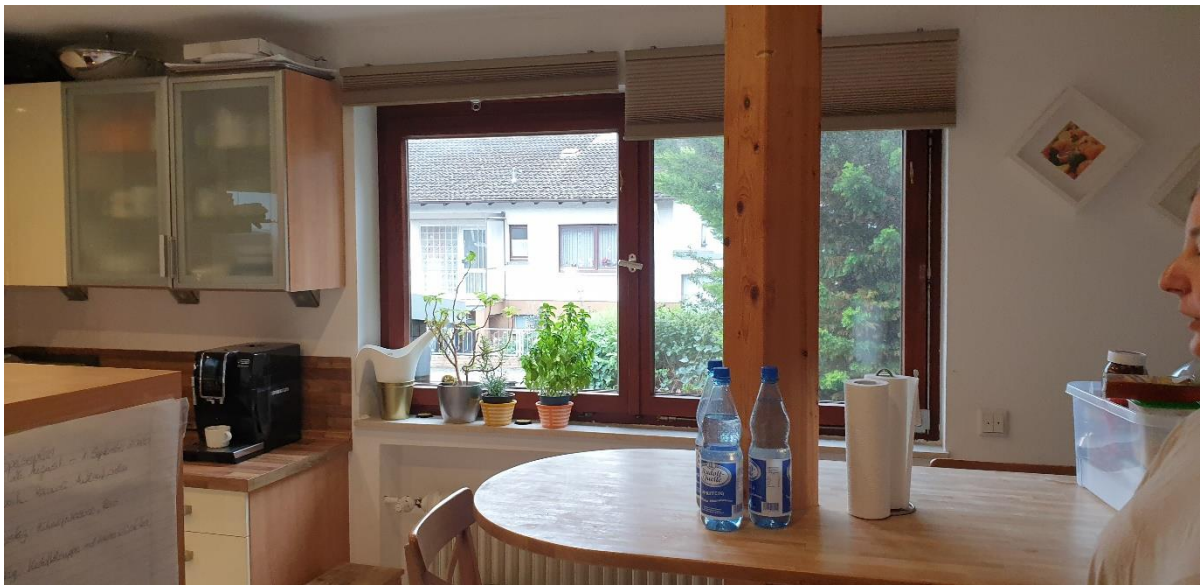
Abb. 1 e