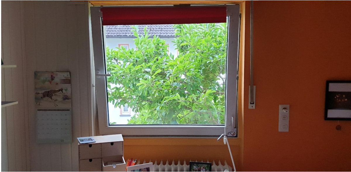
Abb. 1 d