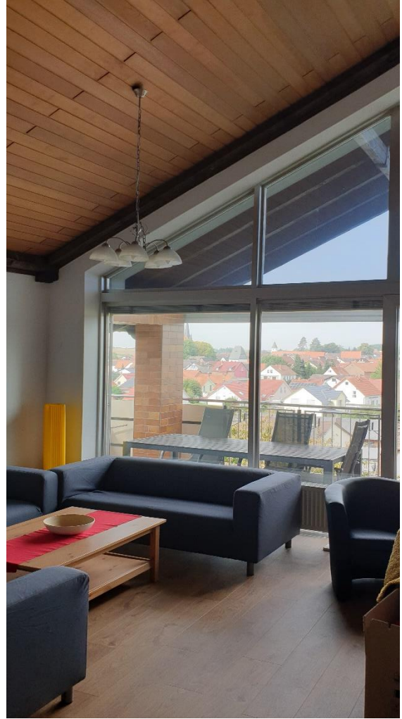
Abb. 1 g