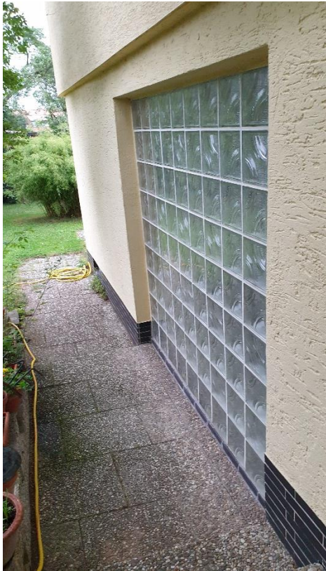
Abb. 1 a