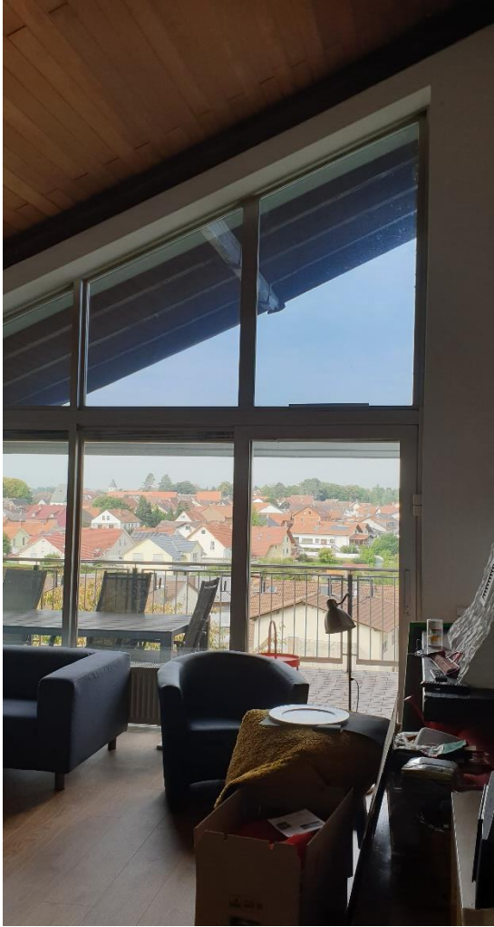
Abb. 1 f